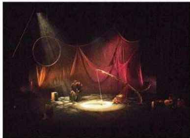
ENTREGADOS. Los actores durante una de las escenas de la obra "Órbita".

El programa "Residencia de Artistas" del Ayuntamiento de Alcaudete es, entre todo, una oportunidad para que los vecinos del municipio puedan asistir, de forma gratuita, a espectáculos artísticos de gran profesionalidad y calidad, pero también en una gran ocasión para pe-